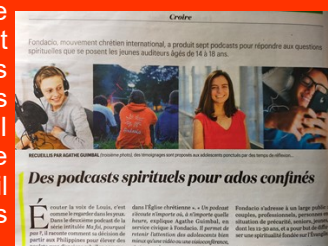
Des podcasts spirituels pour ados confinés